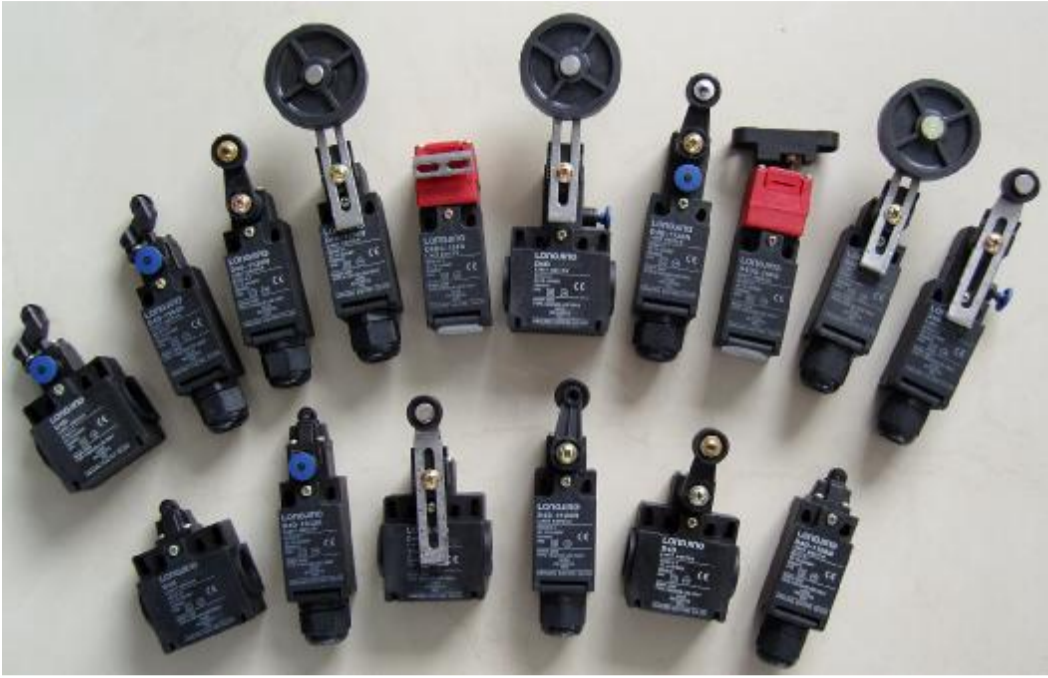
龙井电器的行程开关系列在业内享有很高的品质声誉

一个与国际市场并轨的中国,把外资请进来的同时,中资也应走出去,做成“我中有你、你中有我”的国际资本市场大格局”,从资本层面,必须制定有前瞻性的政策。现阶段中国企业的崛起是以“世界工厂”为标志,下一阶段,则必将以资本输出为里程碑。