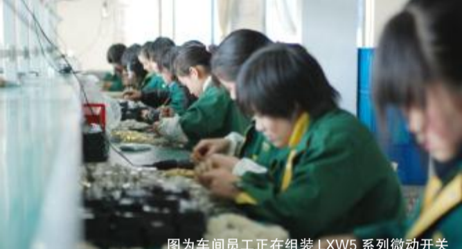
图为车间员工正在组装 LXW5 系列微动开关

龙井电器项目技术负责人介绍,该产品广泛适用于家用电器、机床、电力行业等电路中,作