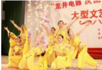
图为龙井电器员工自编自演的民族舞

吴国强说:“中国强盛为企业发展创造了良好的经济环境,龙井电器今日的成就更是得益于祖国的繁荣昌盛。”吴国强还表示,我国改革开放以来,与众多国家建立了贸易关系,国家的强大也为国内企业的对外贸易树立了保障,我们今天不仅要祝福伟大中华,还要加快我们企业的建设,为民族的富强添砖加瓦。”