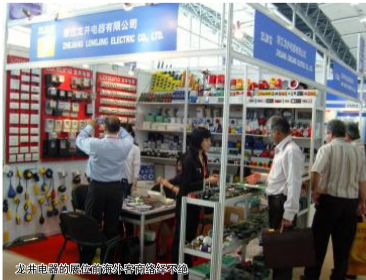
龙井电器的展位前国外客商络绎不绝

一位来自瑞典的客商在接受记者采访时表示,来自中国浙江的产品在欧洲的销售前景很好,他们会继续加强与这些地区的生产企业在进出口领域的合作。